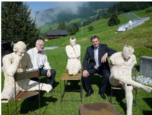
Präsident Busek und LH Platter