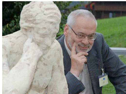
Erhard Busek in Denkerpose